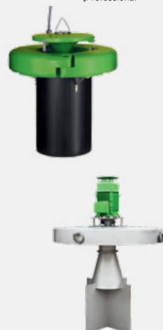
FUCHS AquaClear „Professional“